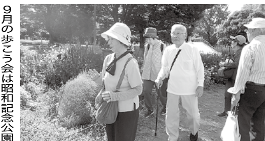
9月の歩こう会は昭和記念公園