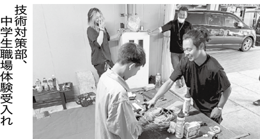
技術対策部、中学生職場体験受入れ