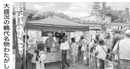
大盛況の鶴代名物わたがし