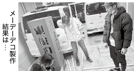
メーデーデコ製作 結果は…