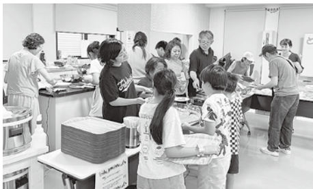
子ども食堂夏まつり ver.