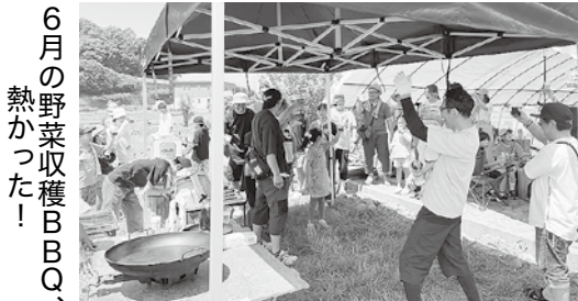
6月の野菜収穫BBQ、熱かった！