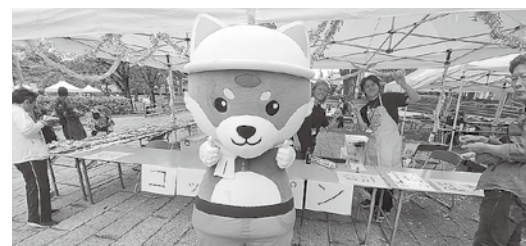
どけんまつり、コッペサンドは完売！