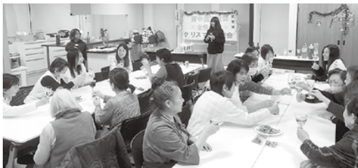
クリスマスは大交流！