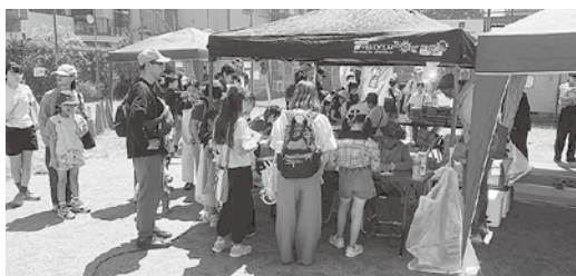
朝から大行列の木工作教室