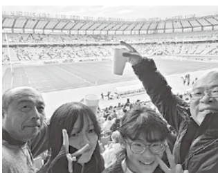
ピッチは目の前、迫力満点

チケットプレゼント 今後のスケジュール 2/15(日) 秩父宮 締切2/5 2/28(土) 白波 締切2/12 ※締切日15時までに支部までご連絡ください。応募多数の場合は抽選となります