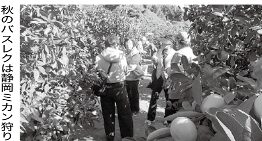
秋のバスレクは静岡ミカン狩り