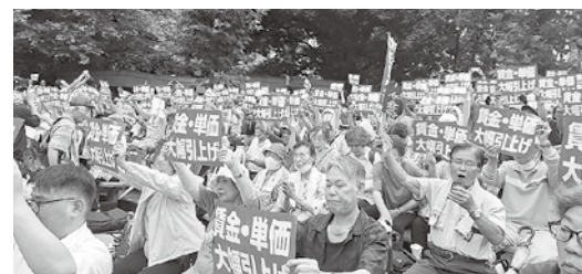
予算要求集会 日比谷に響け！