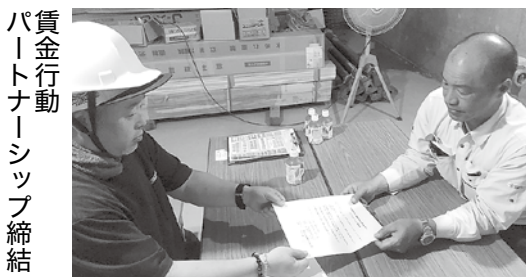
賃金行動 パートナーシップ締結