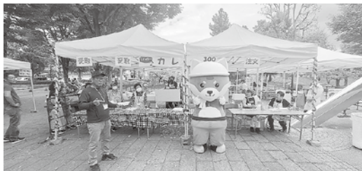
どけんたろうも盛り上げた！