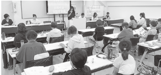
活動者会議では大いに学び議論