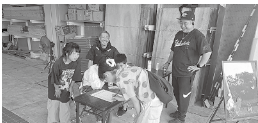
子ども食堂は4年目に突入