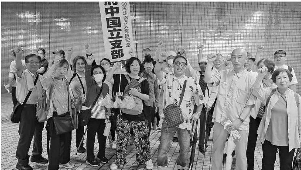
力を合わせてガンバロー！

第614号 2026年1月号 組織現勢2795人 1/1(仮)現勢 東京土建一般労働組合 府中国立支部教宣部 発行者 きたたま編集委員会 事務所 府中市晴見町2-15-5 電話 042-363-6554(代) FAX 042-363-6847 http://www.doken-fk.com/