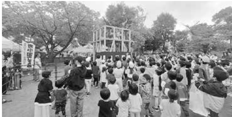
どけんまつりは3500人が来場